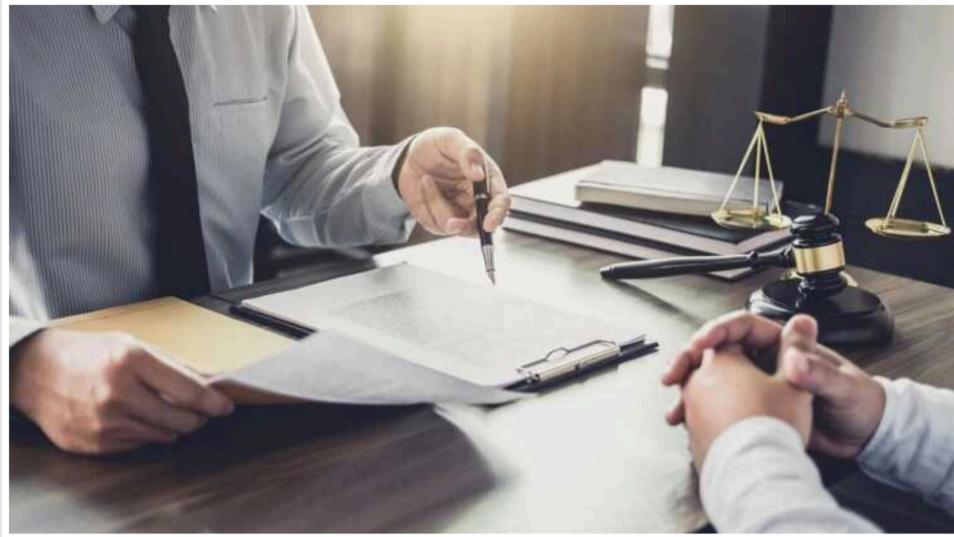
В Україні роботодавці зможуть звільнити працівників за порушення правил поведінки

Нещодавно Верховна Рада подолала вето президента України та схвалила з урахуванням його пропозицій проект закону №7731 щодо встановлення додаткових підстав розірвання трудового договору з ініціативи роботодавця.