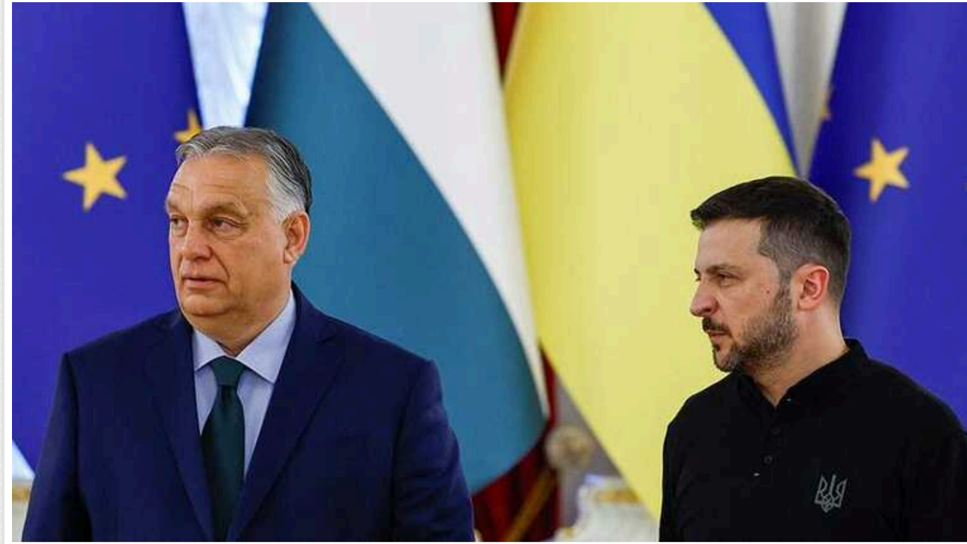
Орбан запропонував Зеленському спочатку припинити вогонь, а потім вести мирні переговори з Росією

Прем'єр-міністр зазначив, що війна в Україні дуже інтенсивно впливає на безпеку в Європі.