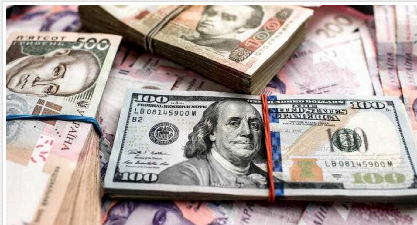
Нацбанк підвищив курс долара до нового історичного максимуму

В Україні курс долара на міжбанку перевищив курс держбюджету і вийшов на 40,80 грн/$, а готівка досягла 41,20 грн/$.