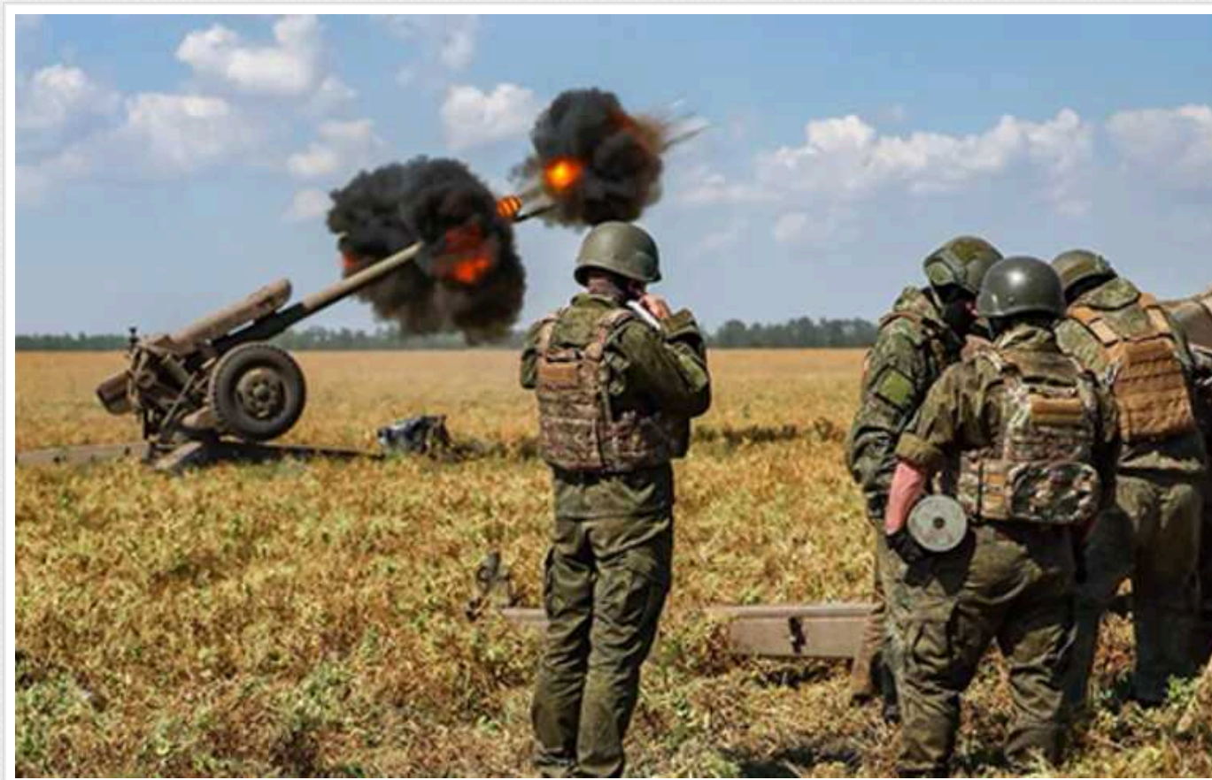
Росіяни посилили атаки на Часів Яр, – ЗСУ