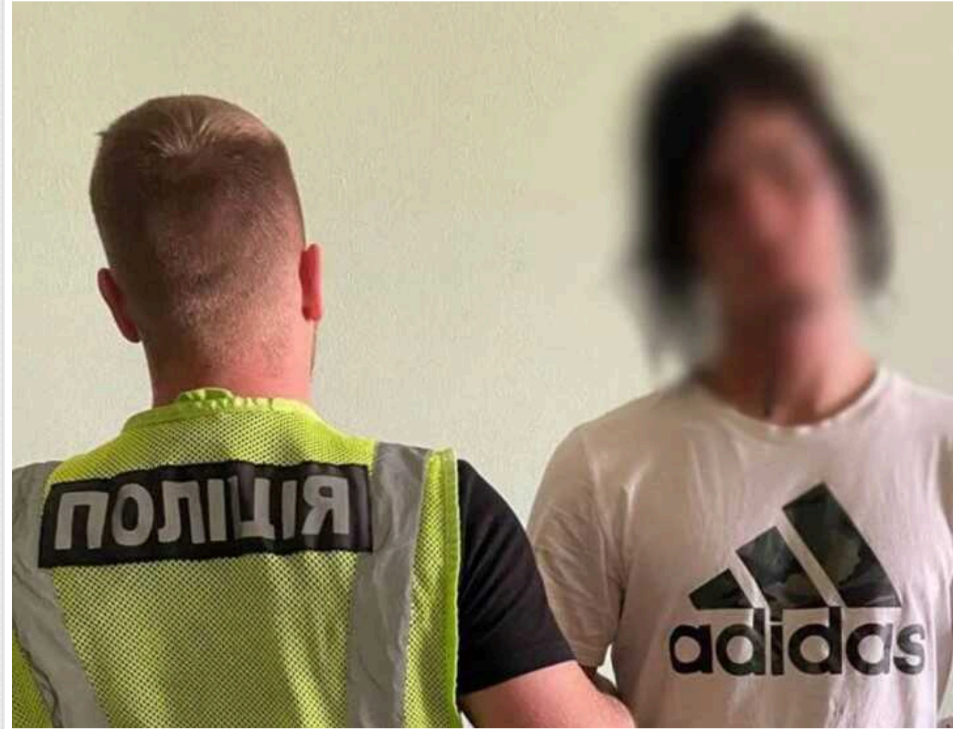
У Києві затримали 22-річного рецидивіста, якого підозрюють у крадіжці

У Києві правоохоронці затримали раніше судимого 22-річного молодика, який, за версією слідства, обікрав торговельний кіоск на Харківському масиві. Чоловік заліз у МАФ через віконце, а потім виніс гроші, товар та мобільний телефон.