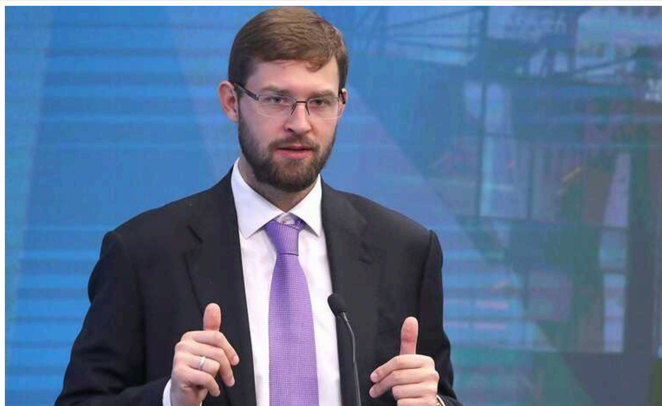
Як «Фрідом Фінанс» Тимура Турлова допомагає російським олігархам та спецслужбам виводити гроші на Захід

Журналісти розповіли про злочинну групу, контрольовану російськими спецслужбами, яка називається Інвестиційна компанія ТОВ ІК «Фрідом Фінанс».