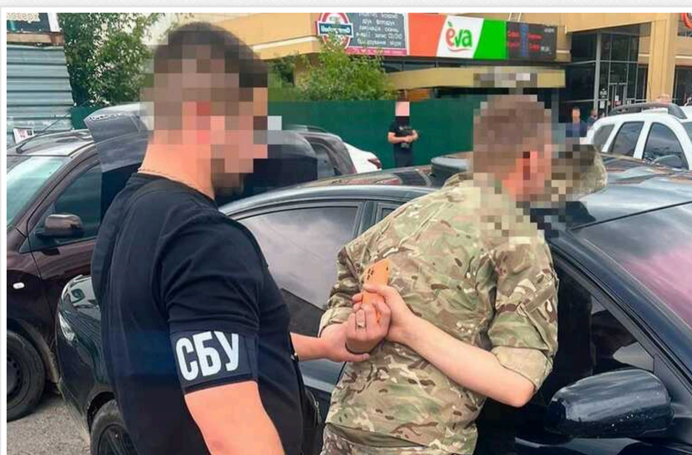
СБУ у Рівному затримали ділків, які організували схему вивозу чоловіків за кордон

За свої послуги брали від 3500 до 4500 доларів. Сума залежала від терміновості та матеріальних можливостей «ухилянтя».