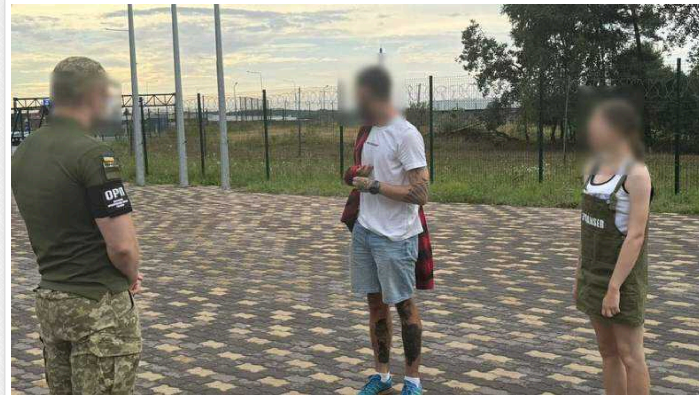
На Львівщині прикордонники викрили чоловіка та жінку, які уклали фіктивний шлюб для виїзду чоловіка за кордон

На Львівщині прикордонники викрили харків'янина та мешканку Львівщини, які уклали фіктивний шлюб для виїзду чоловіка за кордон. За ці послуги він заплатив жінці 7000 доларів.