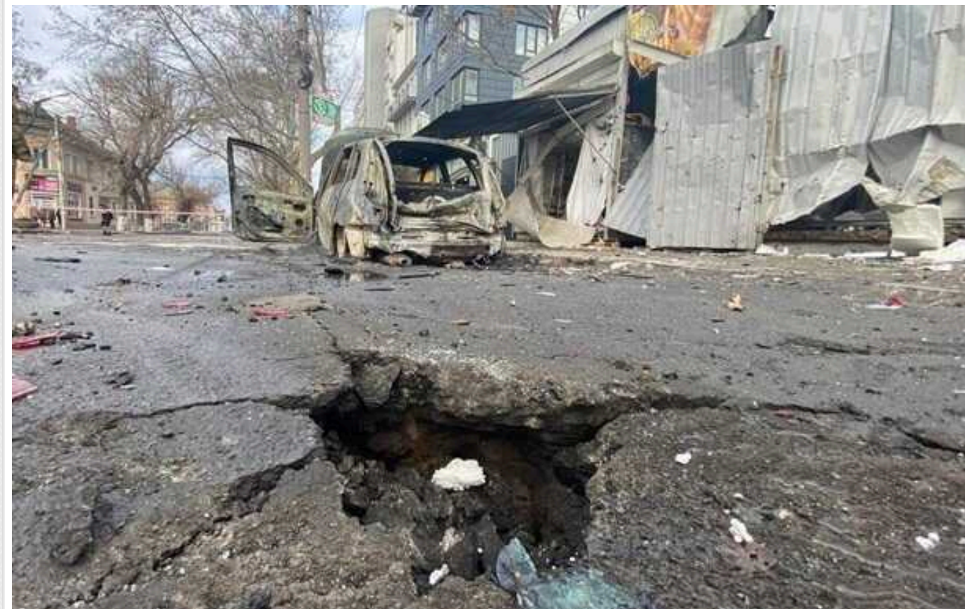
Росіяни масованим вогнем обстрілюють Херсон: є постраждалі