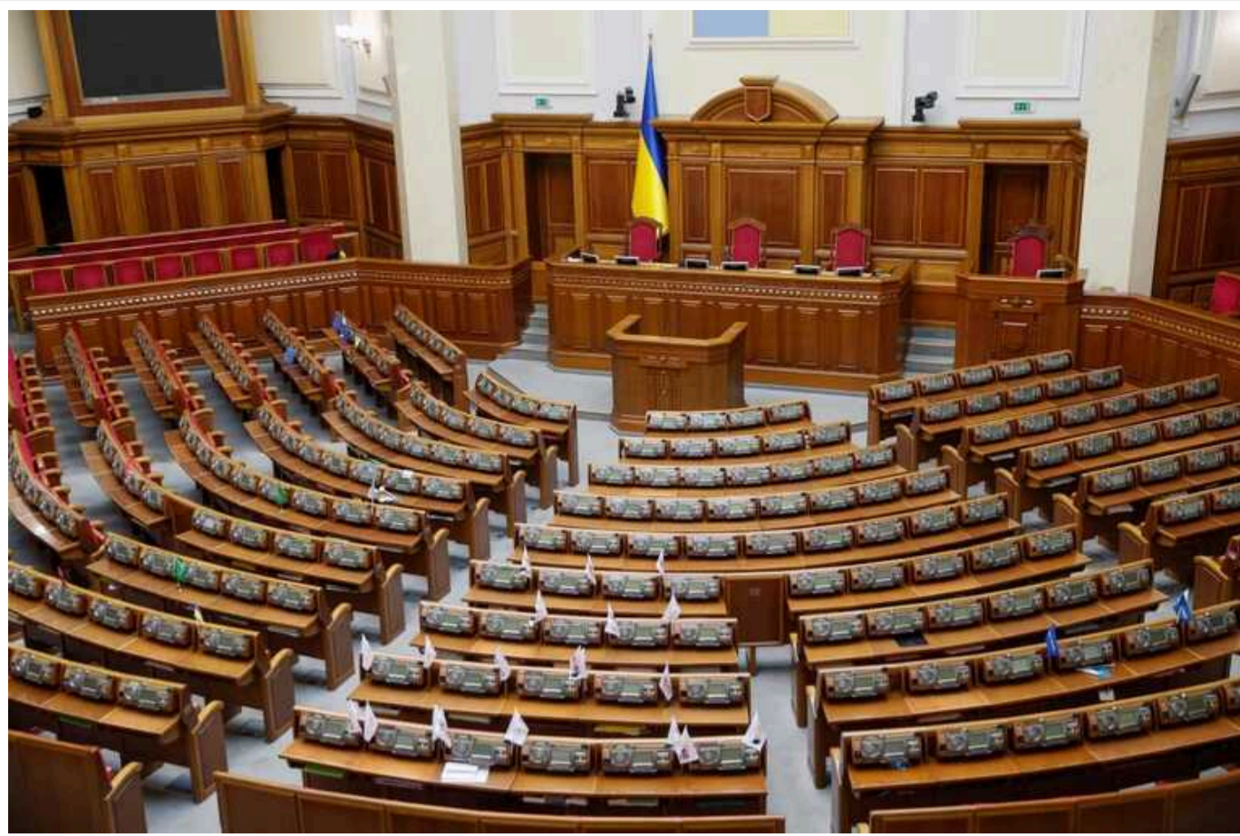
Пауза у роботі Ради пов'язана з «масштабними планами» щодо кадрових змін в Уряді, – джерело