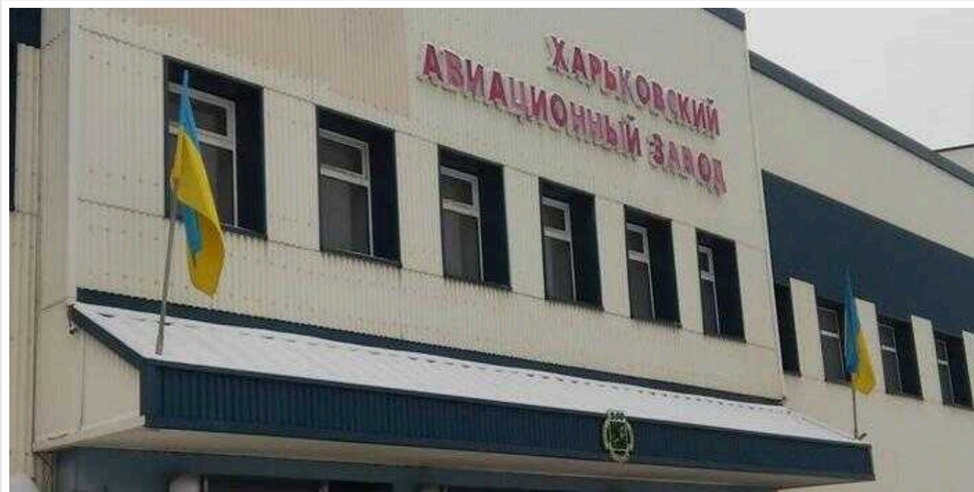
НАБУ та САП передали до суду справу екскерівника Харківського авіазаводу, який завдав збитків на понад 36 мільйонів гривень

Слідство встановило два епізоди злочинної діяльності експосадовця.