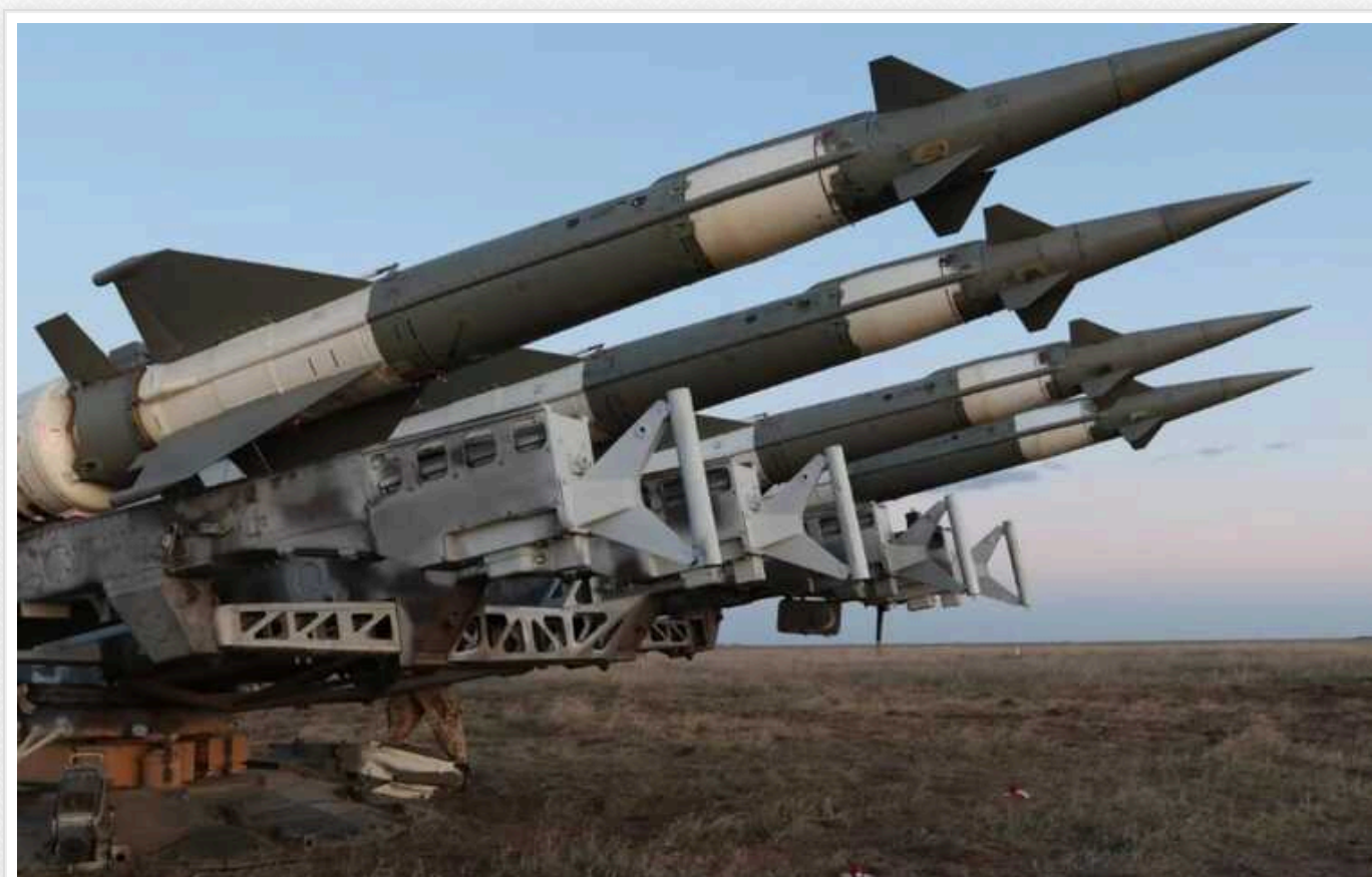
ЗСУ показали ЗРК С-125, який збиває новітні "Калібри" та боронить Одещину

Установка протиповітряної оборони, яка збиває цілі над Одещиною, працює ракетами, яким по 40-50 років. Ці ракети завдяки бійцям ЗСУ знешкоджують надсучасні снаряди ЗС РФ.