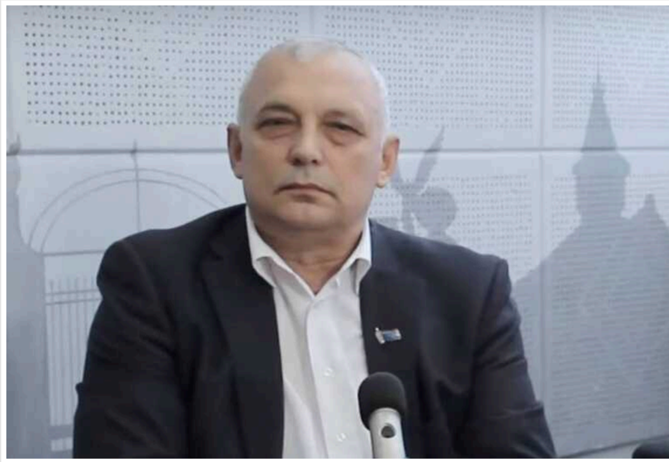
Голову екоінспекції Карпатського округу Миколу Ладовського викрили у незаконному збагаченні

Начальника Державної екологічної інспекції Карпатського округу Миколу Ладовського викрили у незаконному збагаченні.