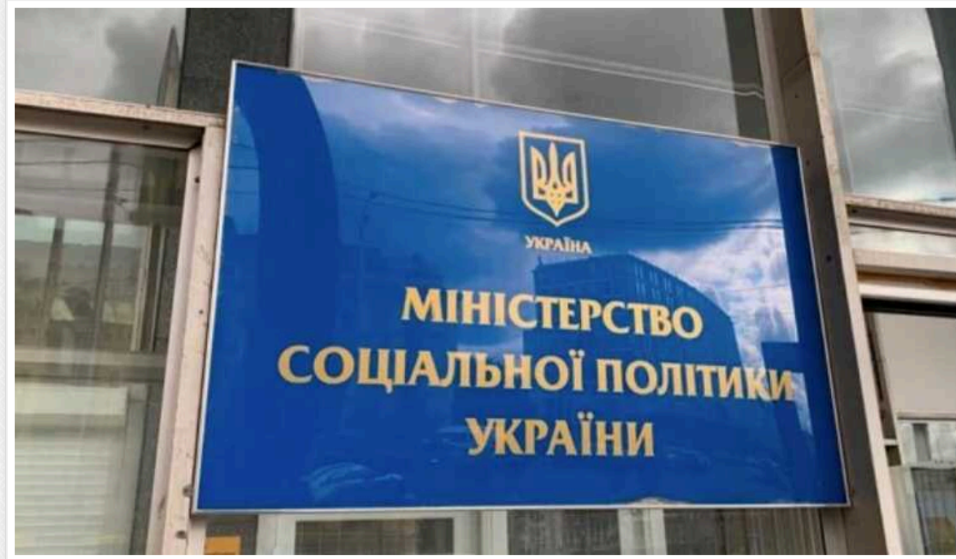
Податкова буде отримувати інформацію про домашніх працівників

Міністерство соціальної політики України пропонує внести зміни до порядку повідомлення Державній податковій службі про прийняття працівника на роботу/укладення гіг-контракту.