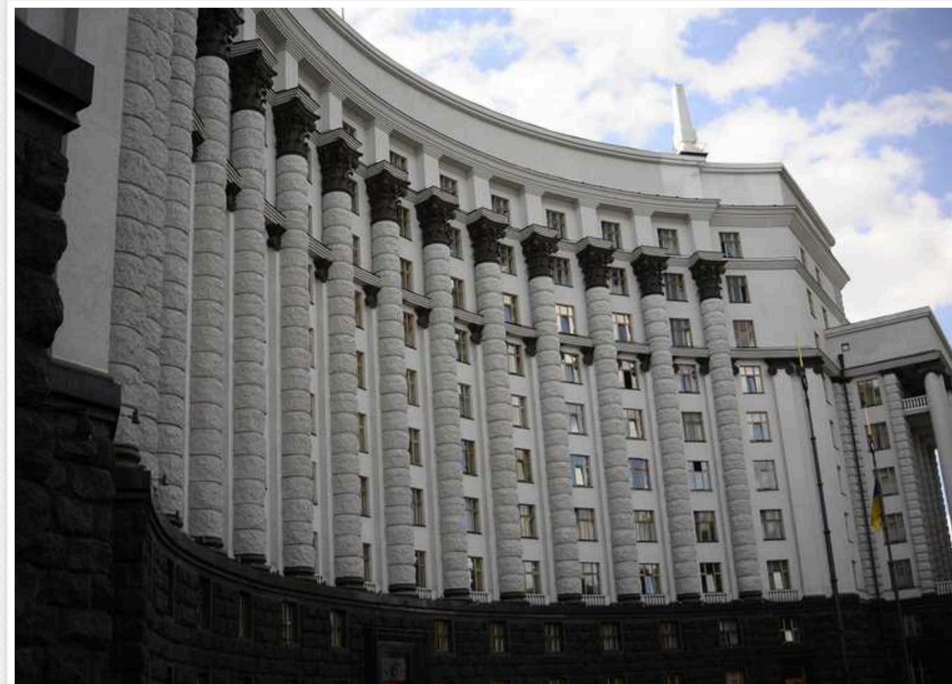
У Кабміні зробили прогноз на наступні 3 роки: долар вищий за 45 і повільне зростання економіки

Кабінет міністрів у Бюджетній декларації на 2025-2027 роки прогнозує зростання курсу долара до більш ніж 45 гривень, а також уповільнення зростання економіки наступного року.