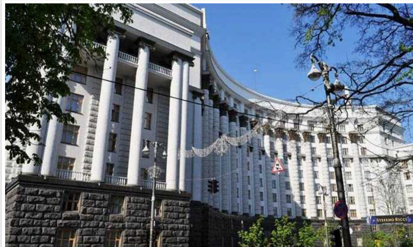
Кабмін планує відновлення економіки та скорочення витрат на оборону

На минулому тижні, у п'ятницю, Уряд схвалив Бюджетну декларацію на 2025-2027 рік, яку вже узгоджено з донорами, зокрема з МВФ.