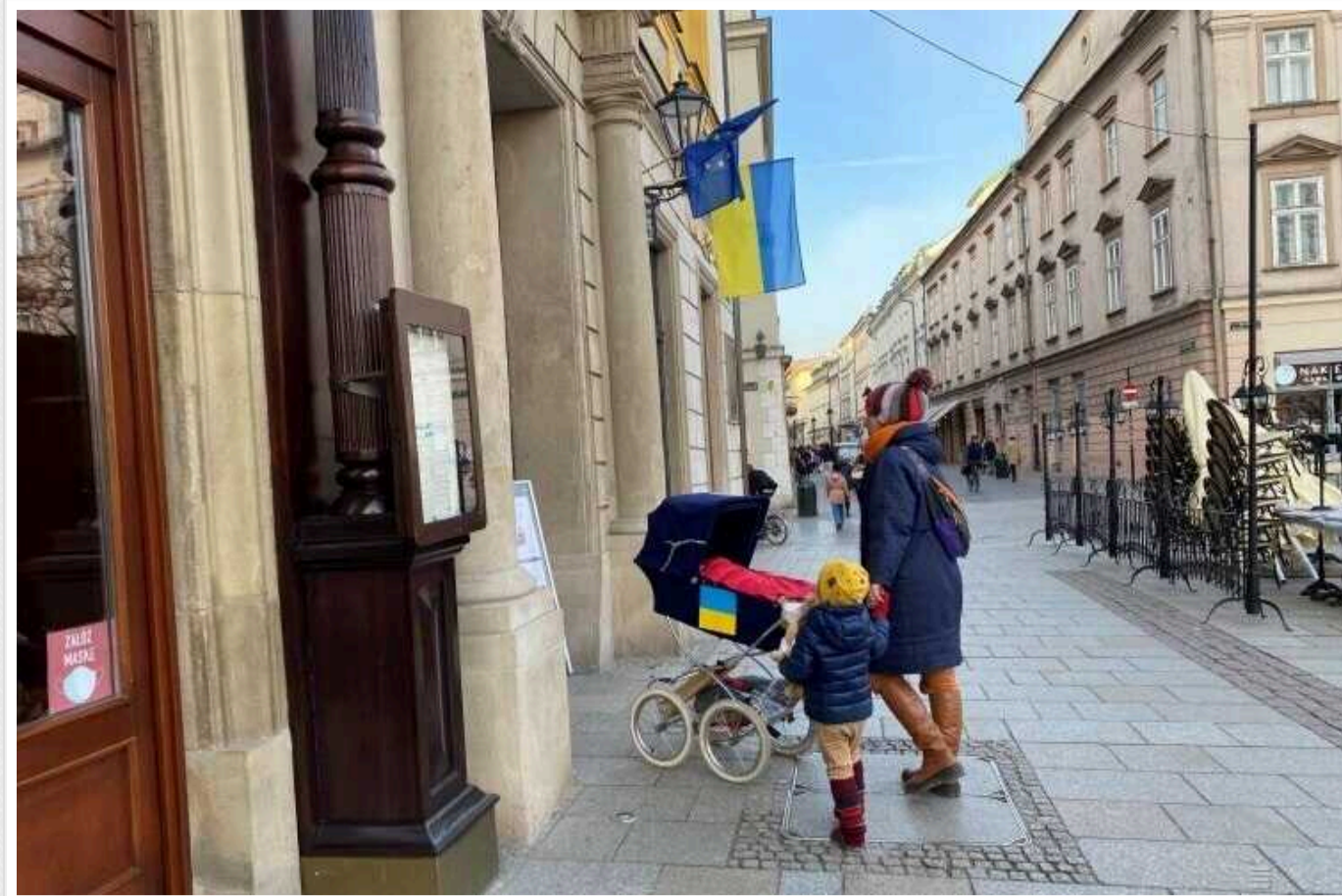
Польща від 1 липня змінює правила для біженців з України

Уряд Польщі від 1 липня 2024 року змінює правила, що регламентують норми перебування українців на території країни. Ключовим елементом закону є продовження терміну легального перебування українських біженців.