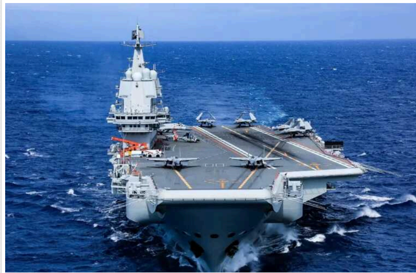
Китай підтягнув до Філіппін авіаносець Shandong, – ЗМІ

Маневри китайського авіаносця проходять напередодні великих військових навчань Японії та країн НАТО поблизу російських кордонів біля острова Хоккайдо. У МЗС РФ вже висловили "рішучий протест".