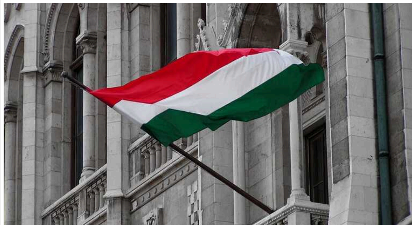
Угорщина почала головувати в Раді ЄС

Головування Угорщини в одній з інституцій Європейського Союзу триватиме до кінця цього року.