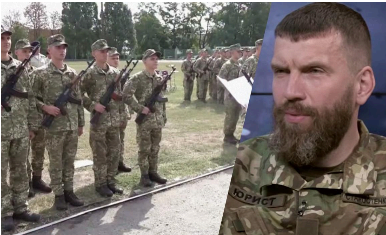
Військовий вважає, що БЗВП недостатньо

Старостенко виступає за повернення призову для 18-річних юнаків.