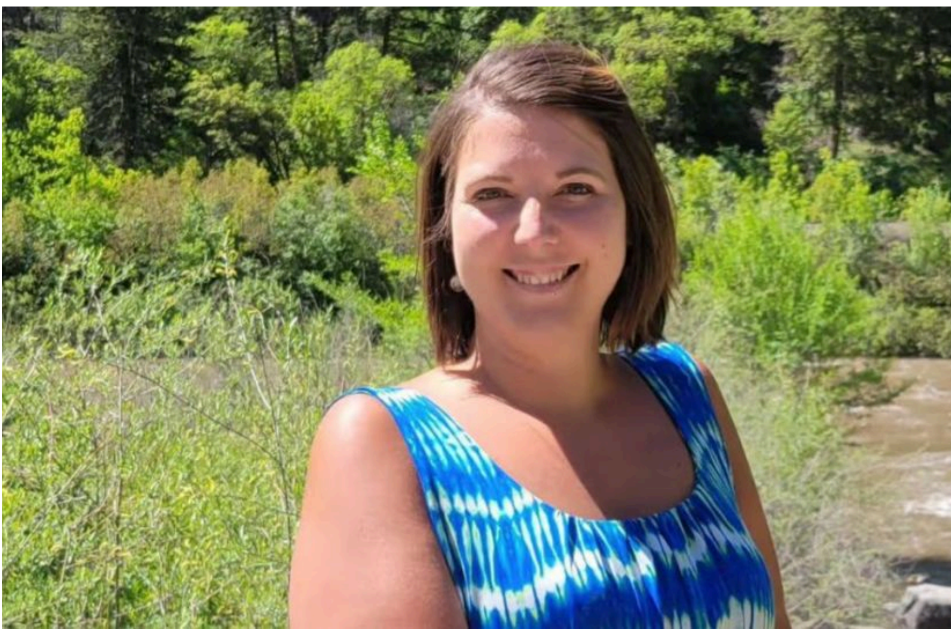
Клінічна смерть

ТКАЧЕНКО ВАЛЕНТИНА — 26 Травня 2026, 21:22 2 Mins Read — ЦІКАВІ НОВИНИ