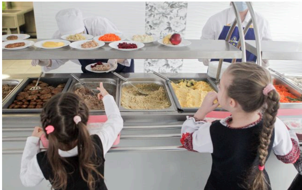
Фото: харчування в школах (Gettyimages)