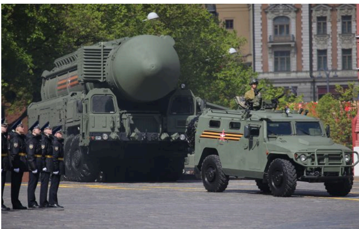
Фото: експерт оцінив загрози ядерного удару по Україні

Розумій ситуацію на фронті через факти, а не чутки з РБК-Україна у Google