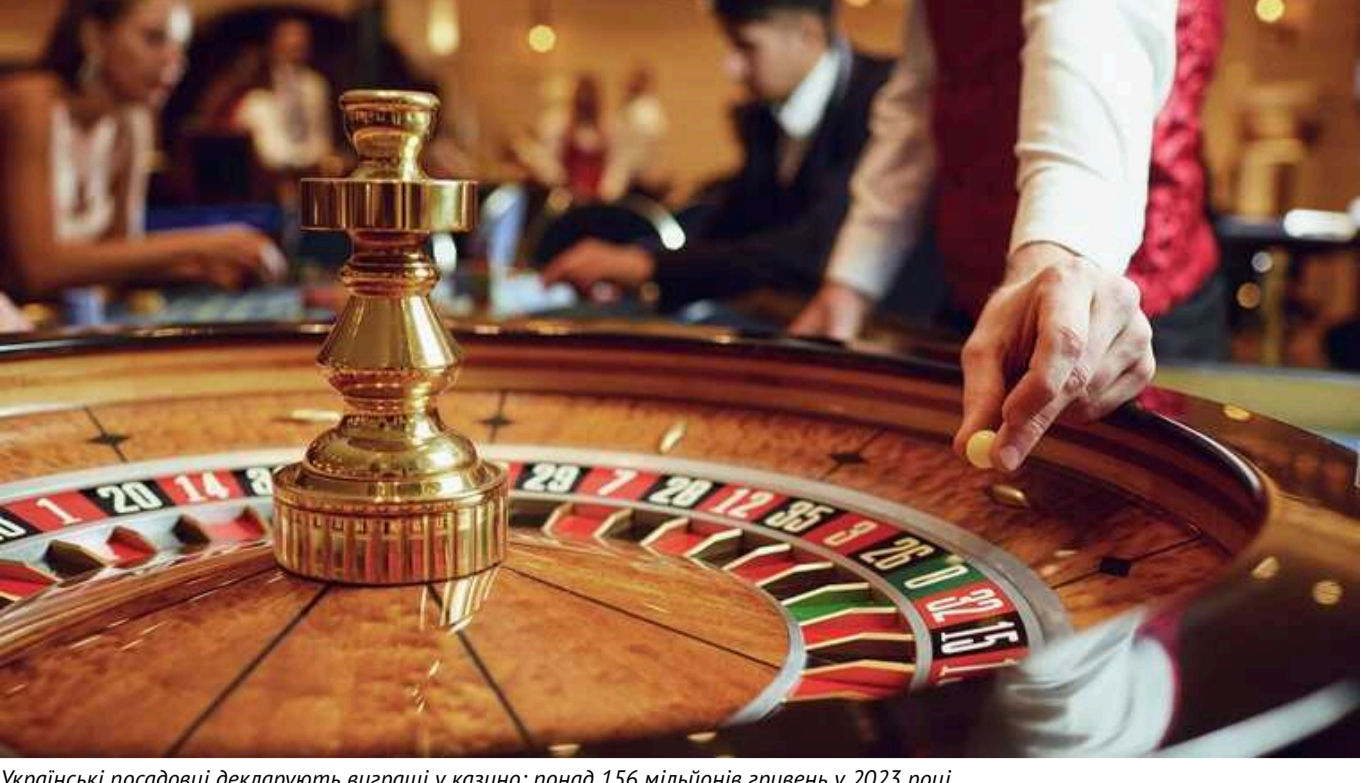
Українські посадовці декларують виграти у казино: понад 156 мільйонів гривень у 2023 році

У 2023 році майже 6 500 держслужбовців задекларували понад 156 млн грн вигравше в онлайн-казино, лотереях та беттингових компаніях.