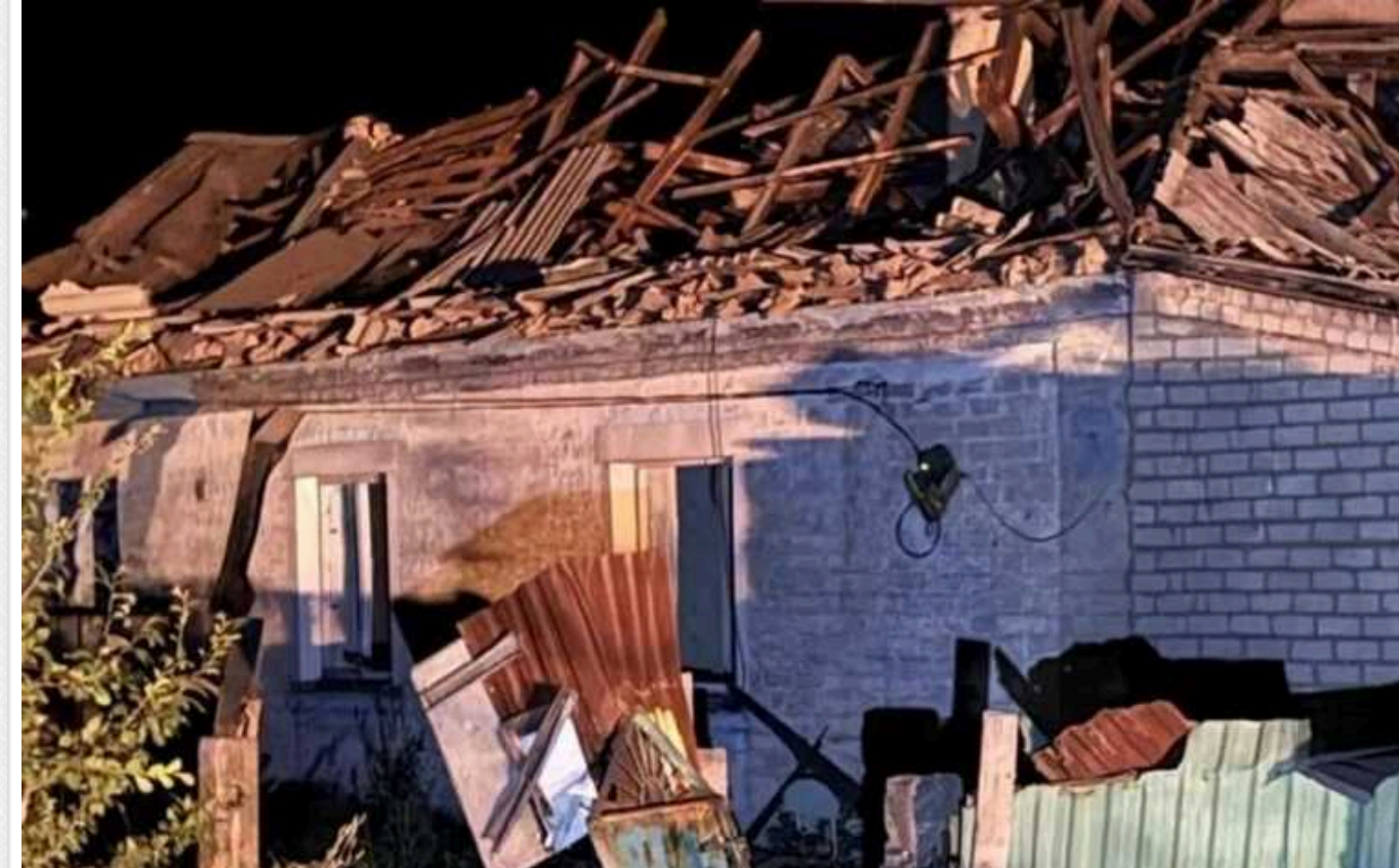
Окупанти вдарили по селу під Селидовим на Донеччині: постраждали шість осіб

Увечері 30 червня російська терористична армія обстріляла селище Цукурине на Донеччині. Ворог атакував населений пункт керованою авіабомбою ФАБ-500.