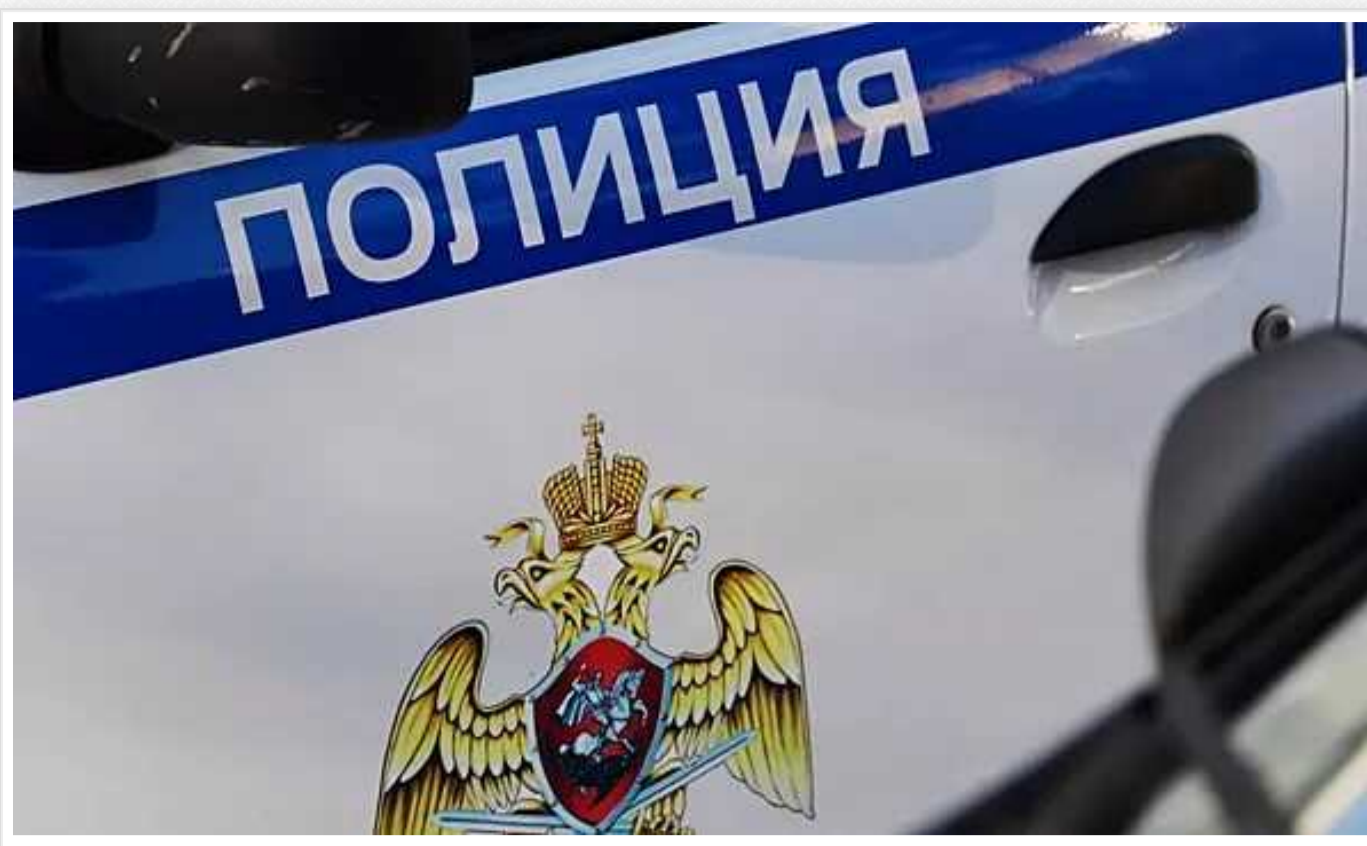
В РФ у Курській області скаржаться на атаку безпілотників: звітують про роботу ППО

У Курській області (Російська Федерація) у ніч проти 1 липня лунали вибухи й тривала робота сил та засобів протиповітряної оборони у кількох районах через нібито атаку дронів.