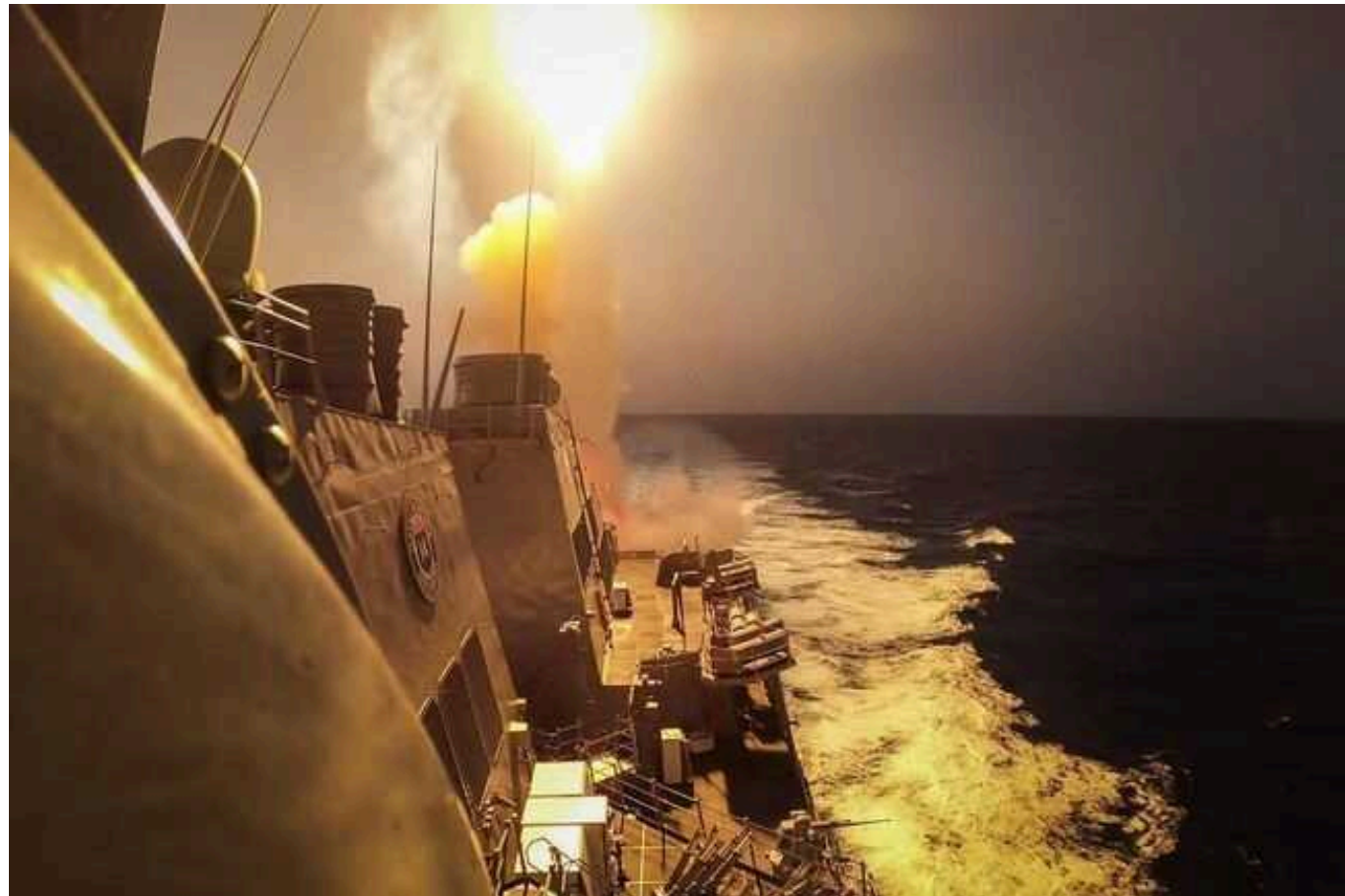
США знищили кілька надводних дронів хуситів у Червоному морі в рамках самооборони

Військовослужбовці США ліквідували в акваторії Червоного моря три безпечні катери еменських хуситів. Такі дії з боку американської армії було вжито в рамках самооборони.