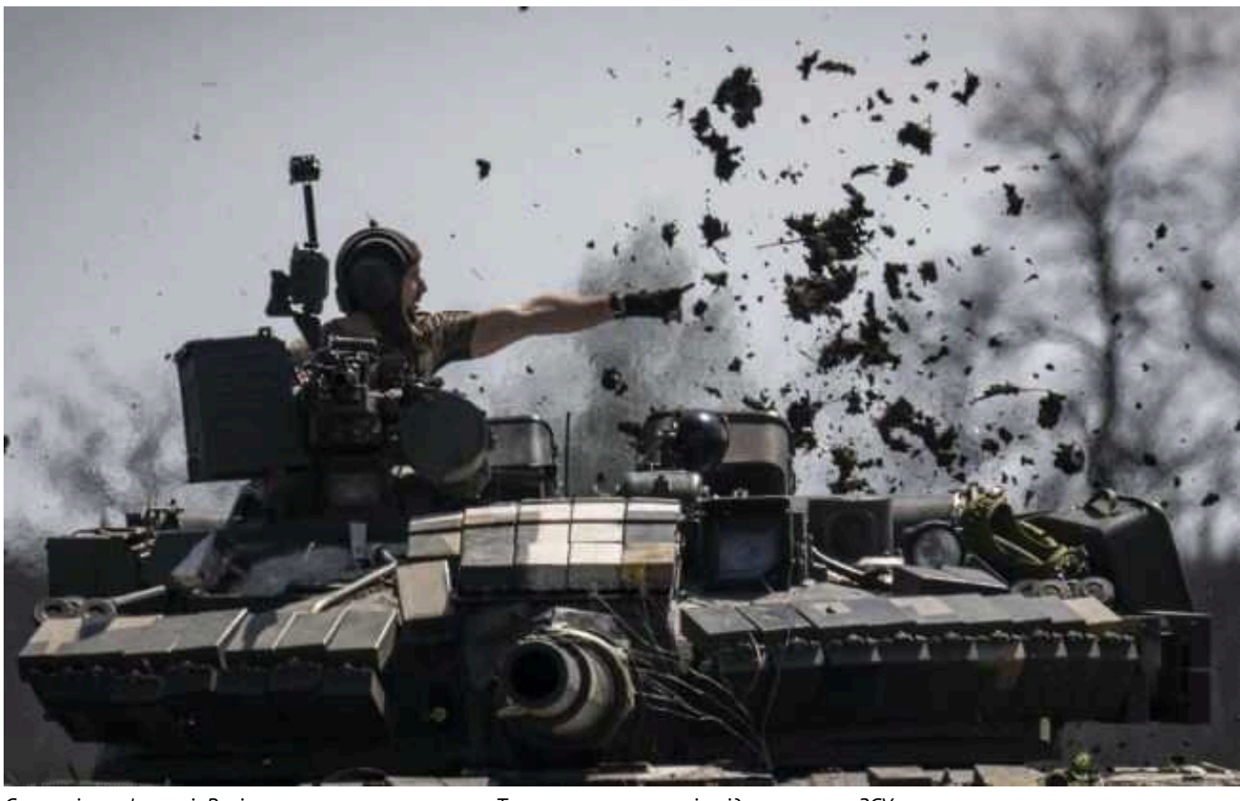
Ситуація на фронті: Росіяни атакують в напрямку Торецька, але ситуація під контролем ЗСУ

На фронті з початку 29 червня вже відбулося 117 бойових зіткнень. Найгарячіша ситуація протягом дня залишалася на Покровському напрямку, але окупанти також намагаються наступати в бік Торецька.