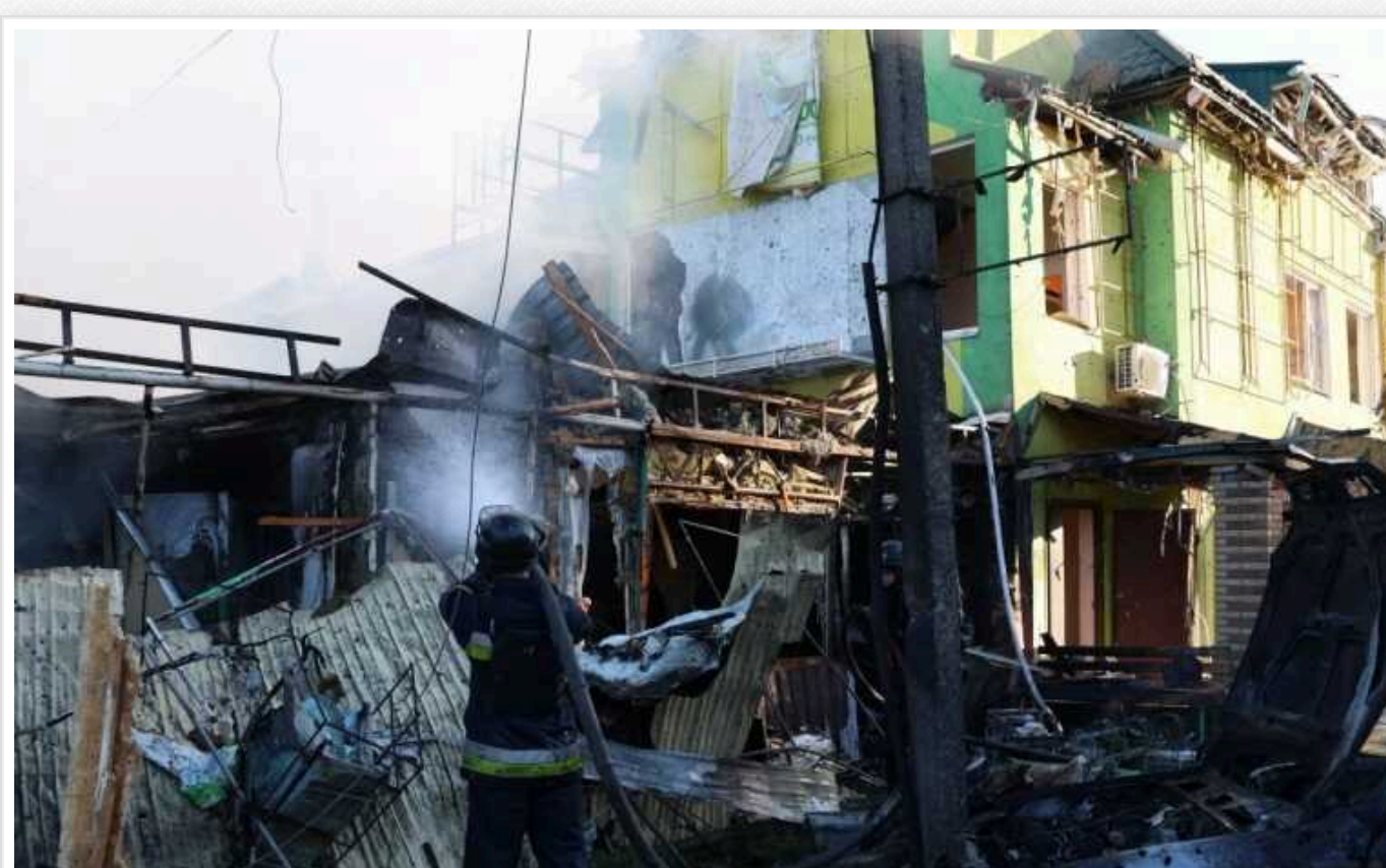
ДСНС ліквідувала наслідки удару РФ по Вільнянську: кількість постраждалих збільшилася

У Вільнянську Запорізької області кількість постраждалих внаслідок сьогоднішнього удару російських окупантів збільшилася до понад тридцяти людей, а число загиблих лишилося таким самим - сім громадян. Рятувальники вже ліквідували наслідки обстрілу.