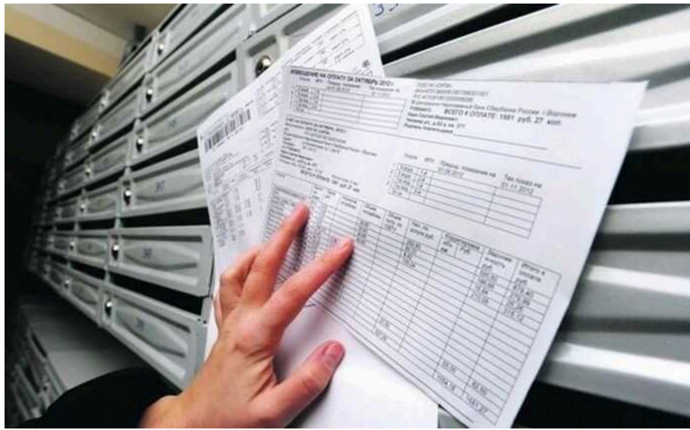
Меморандум із МВФ передбачає поступове підвищення тарифів на комунальні послуги

Українська влада у листі про наміри до керівництва Міжнародного валютного фонду допускає поступове підвищення комунальних тарифів для населення.