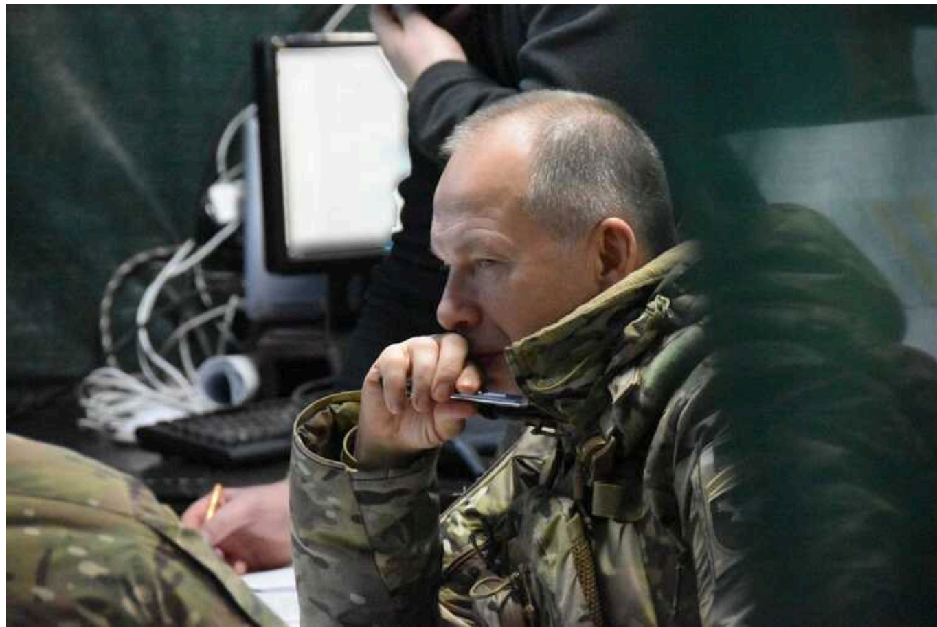
Сирський у День Конституції звернувся до українців із проханням

Конституція України передбачає не лише права та свободи, але й обов'язки. Один з таких обов'язків є захист батьківщини.