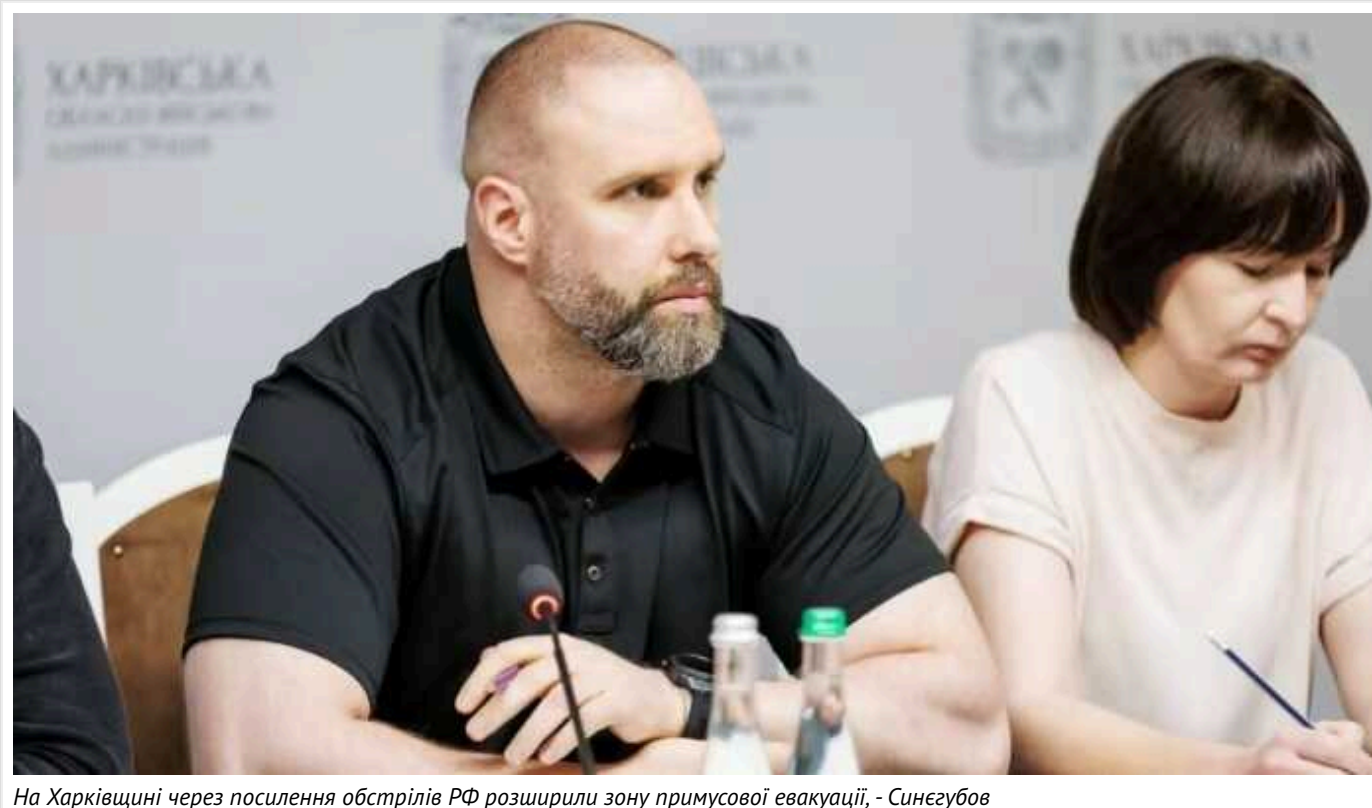
На Харківщині через посилення обстрілів РФ розширили зону примусової евакуації, - Синегубов

28 червня Рада оборони Харківської області ухвалила рішення про примусову евакуацію родин із дітьми з небезпечних для проживання населених пунктів Ізюмського, Богодухівського, Куп'янського, Чугувського районів області.