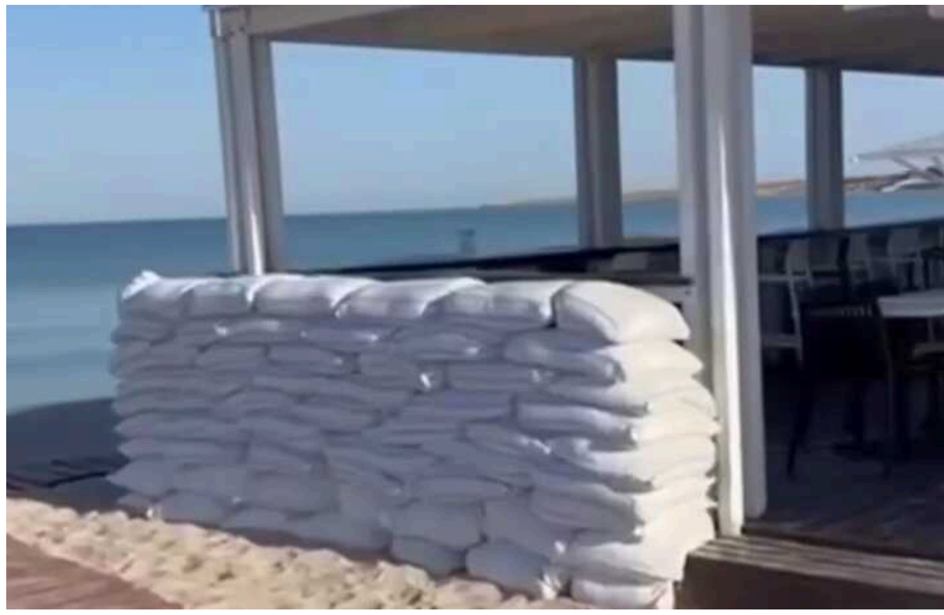
В окупованому Криму в барах на пляжах почали встановлювати барикади, - росЗМІ

Сучасні проблеми потребують сучасних рішень: у барах в Криму почали встановлювати барикади.