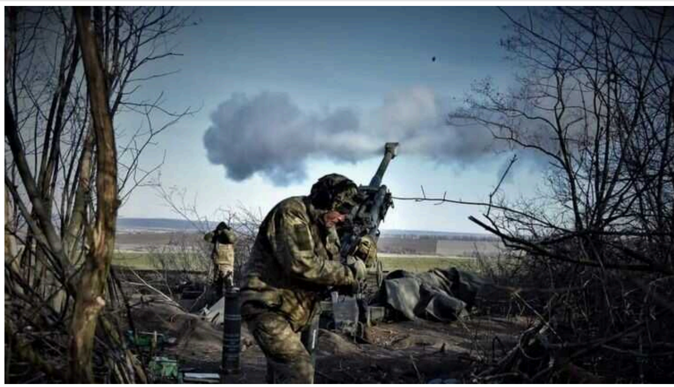
Ситуація на фронті: Окупанти намагаються вклинитися в українську оборону на Краматорському напрямку

З початку доби російські окупанти проявляли максимальну активність на Покровському та Сіверському напрямках. Кількість бойових зіткнень зросла до 81.