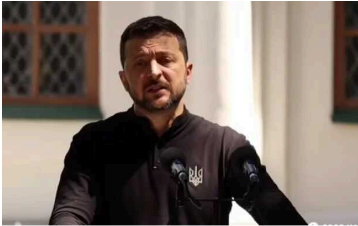
Зеленський висловився про очікування щодо допомоги Україні і саміту НАТО

Президент Володимир Зеленський висловився про очікування щодо допомоги Україні і саміту НАТО. Він заявив, що найголовніше для України зараз – це збільшення кількості зенітних ракетних комплексів Patriot.