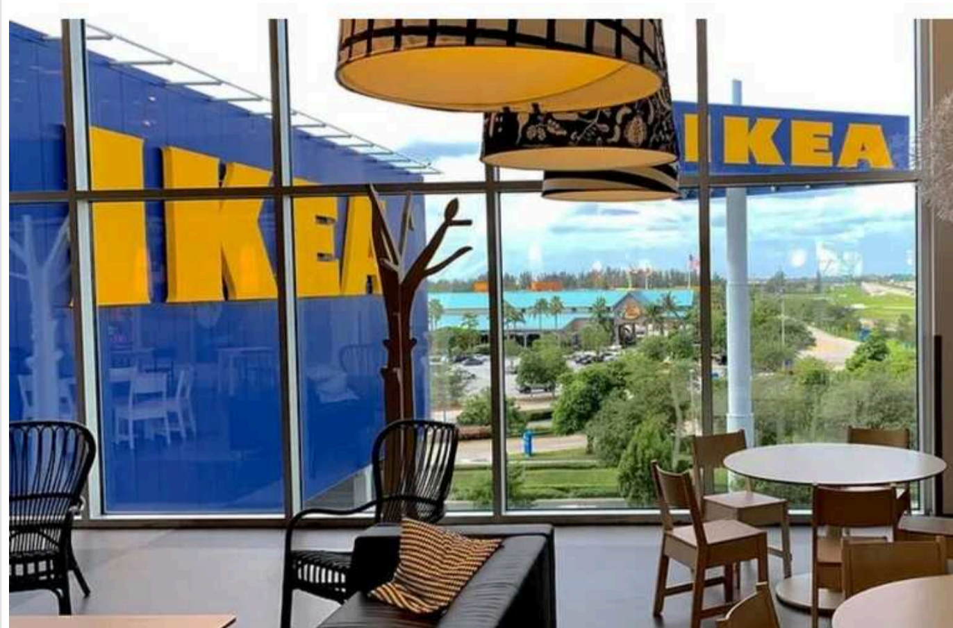
В IKEA не підтвердили своє повернення в Україну

В компанії IKEA не підтвердили, що вже ухвалили рішення відкрити магазин в Україні. Головна умова для поновлення роботи – можливість забезпечити безпеку співробітників та клієнтів.