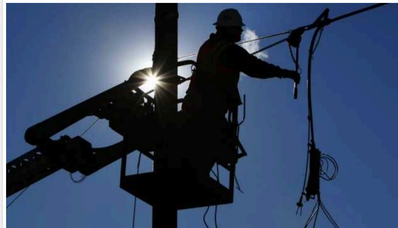
Через обстріли є нові знеструмлення у 4 областях

Через нові обстріли сталися знеструмлення у Дніпропетровській, Донецькій, Харківській та Миколаївській областях. У той же час енергетики змогли заживити 19,5 тисячі абонентів, що знеструмлювалися через бойові дії та технологічні порушення.