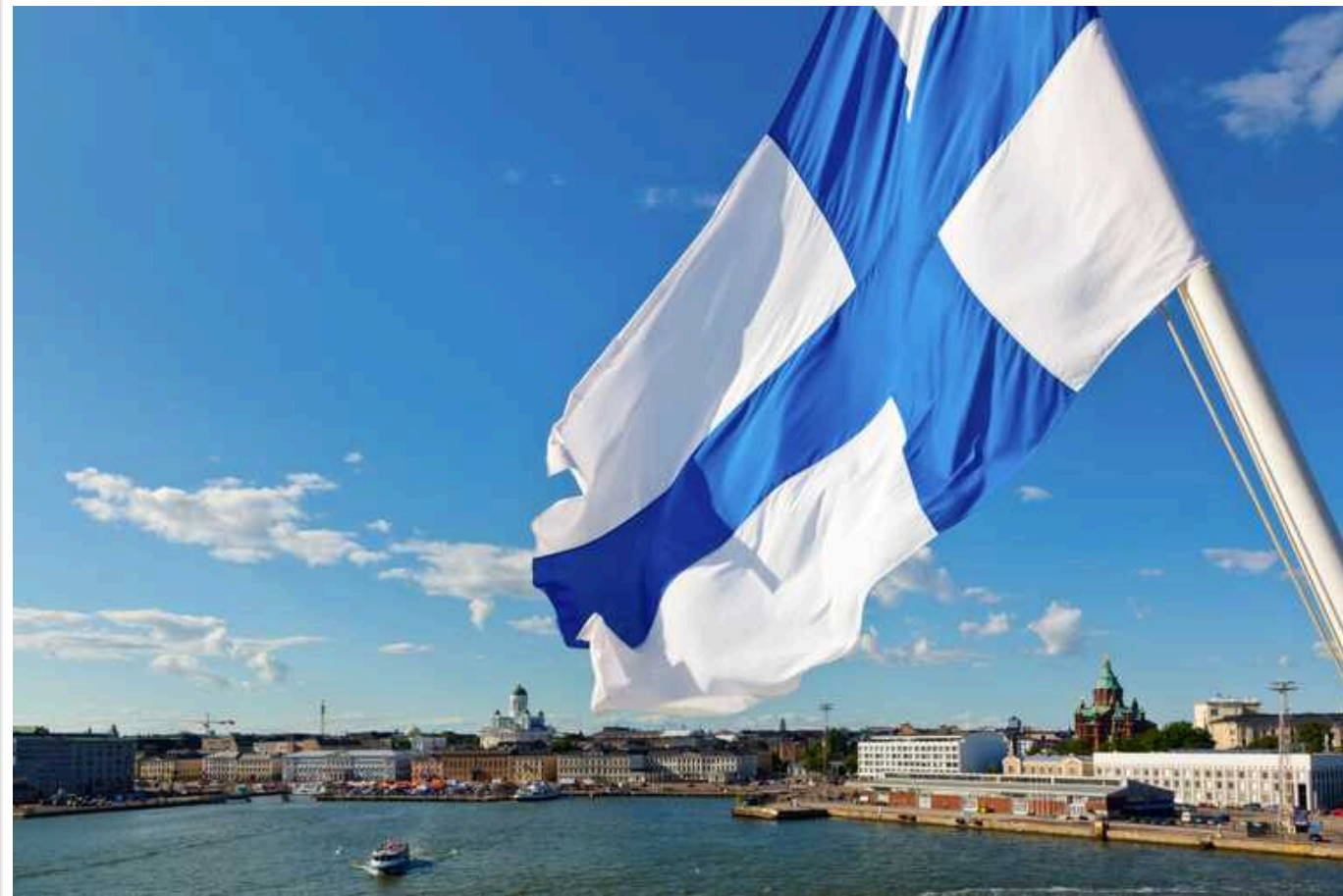
Фінляндія оголосила про новий військовий пакет допомоги для України

Фінляндія оголосила про передачу Україні вже 24-го пакета військової допомоги – рішення ухвалив президент Александер Стубб на пропозицію уряду.