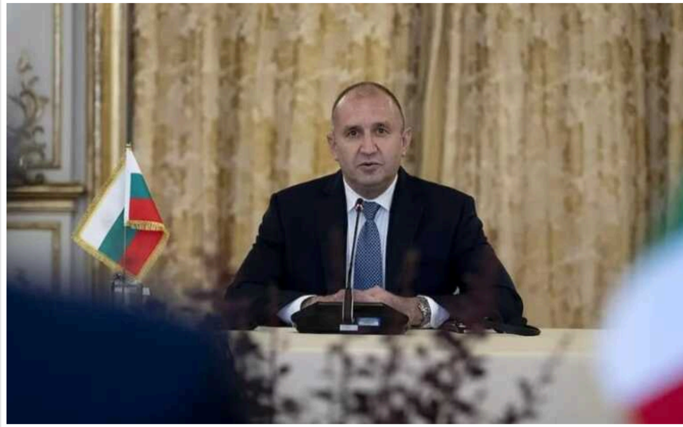
Болгарський президент відмовився брати участь у саміті НАТО через Україну

Президент Болгарії Румен Радев відмовився як очолювати, так і брати участь в болгарській делегації на саміті НАТО у Вашингтоні. Причина – позиція, яку вона має відстоювати щодо допомоги Україні.