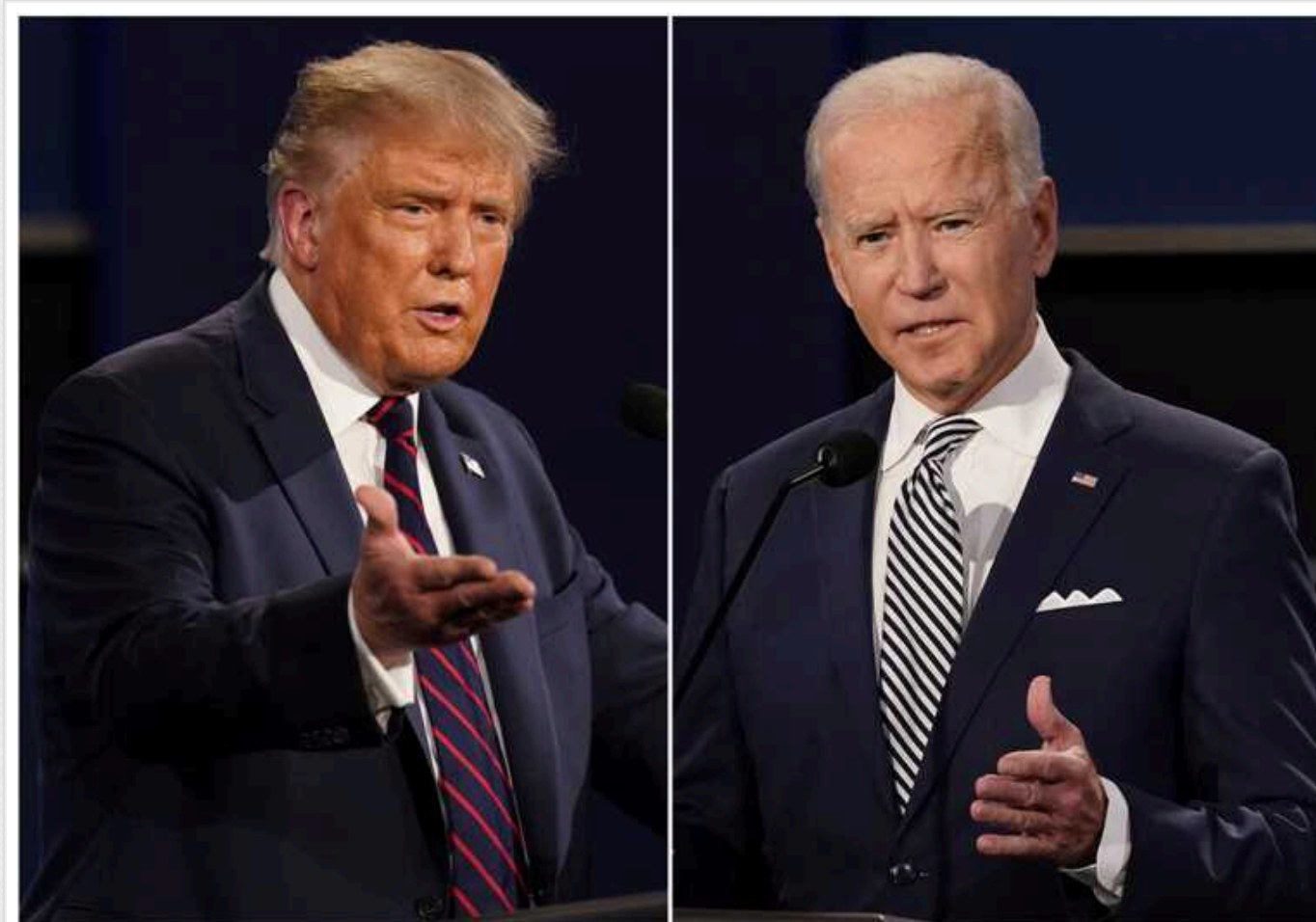
Байден на дебатах назвав Трампа «невдахою» та «лузером»

Чинний президент США Джо Байден під час дебатів назвав свого суперника Дональда Трампа "невдахою" та "лузером".