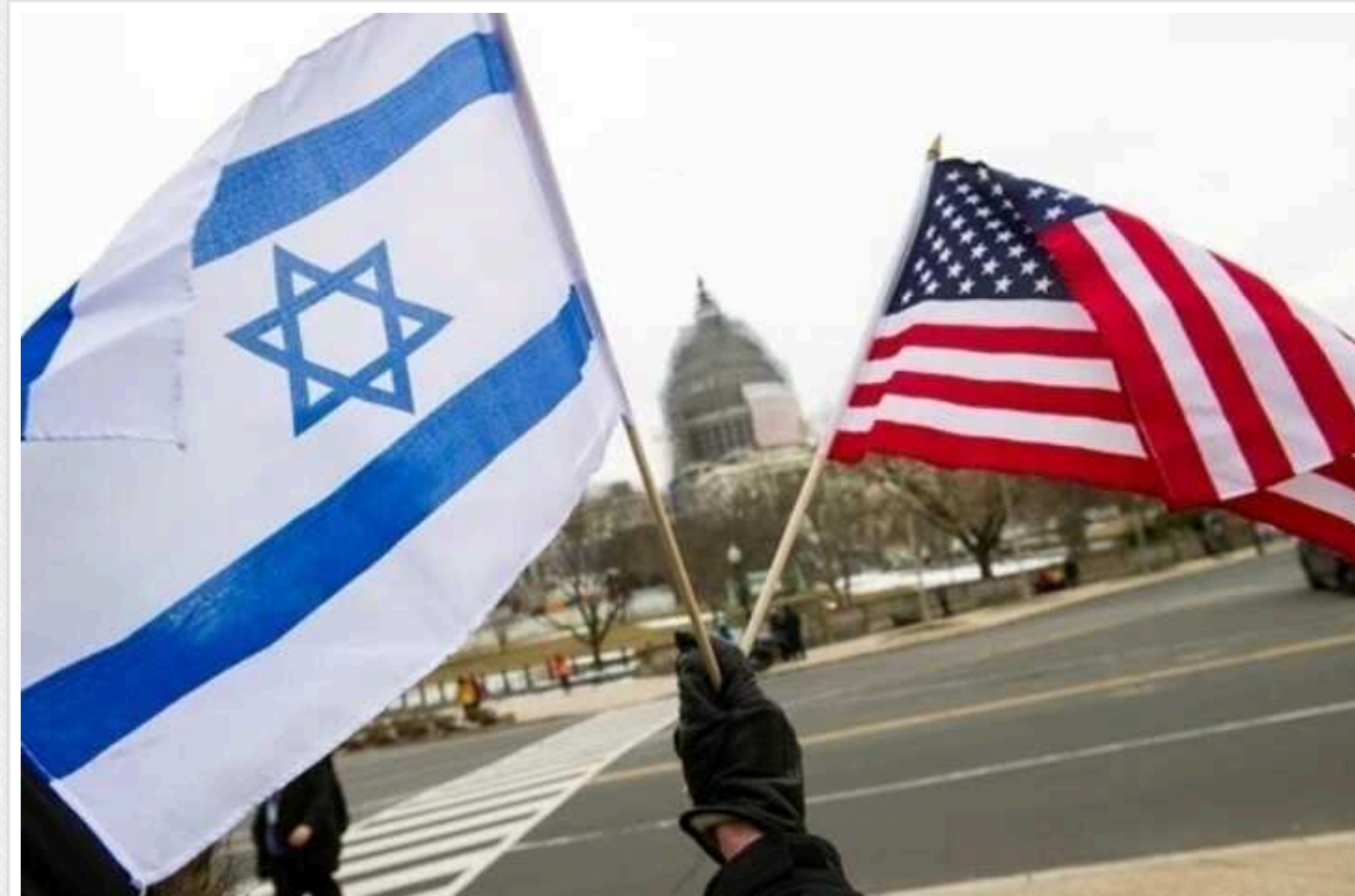
Сполучені Штати відновлять постачання авіабомб Ізраїлю

США відновлять постачання до Ізраїлю 500-фунтових авіабомб. Вони були припинені в квітні через занепокоєння США щодо військової операції Армії оборони Ізраїлю в Рафасі.