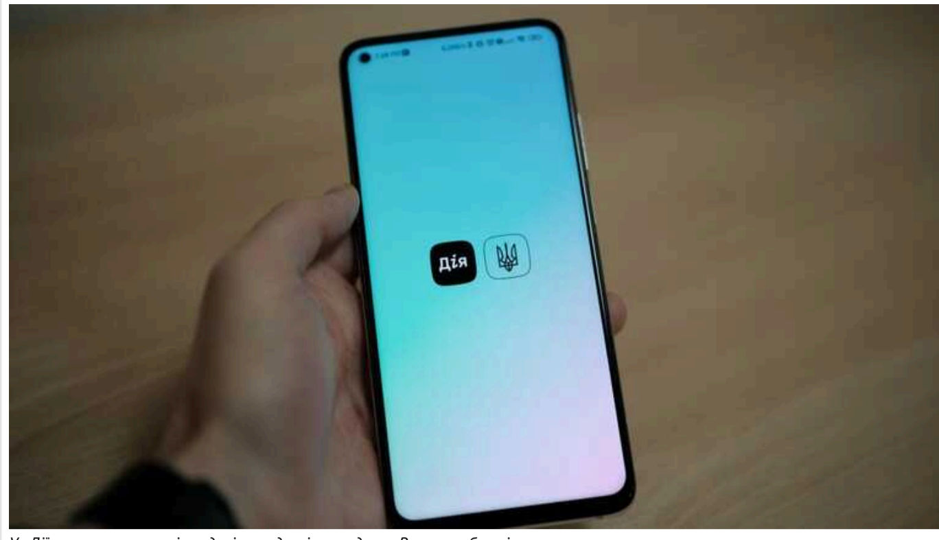
У «Дії» розширять сервіс подачі заяв до міжнародного Реєстру збитків

У застосунку «Дія» буде розширено можливості для подання заяв до міжнародного Реєстру збитків, повідомляє пресслужба Мінцифри. Команда запускає бета-тестування нового етапу.