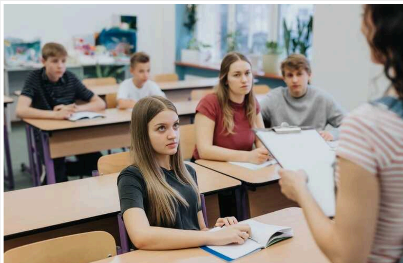
Війна та випуски: Освіта в Україні не в інформаційному тренді