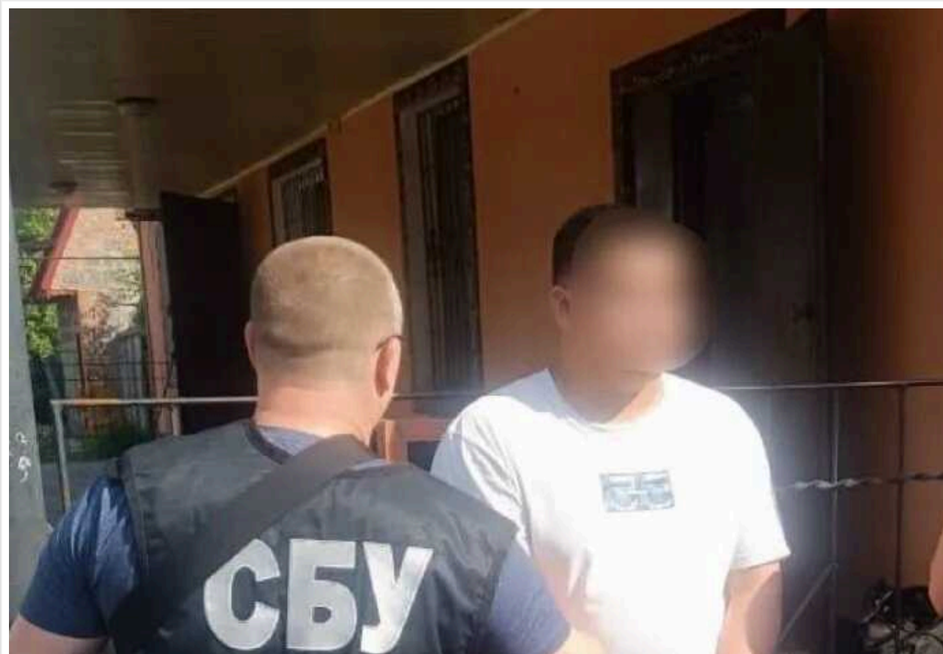
У Миколаївській області викрили схему уникнення мобілізації: за 15 тисяч доларів обіцяли ухилинтям інвалідність

У Миколаївській області викрили чергову схему ухилення військовозобов'язаних громадян від мобілізації. Зловмисники пропонували ухилинтям довідки про фіктивну інвалідність.