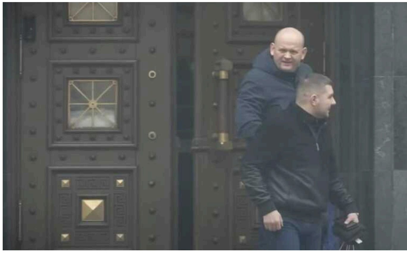
13 співробітників ОГП, котрі отримували подарунки, покарали доганами

Групу з 13 працівників Офісу генпрокурора, які у грудні 2023 року отримували подарунки в будівлі ОГП, покарали доганами, ще трьох залишили без стягнення - через недоведеність порушення.