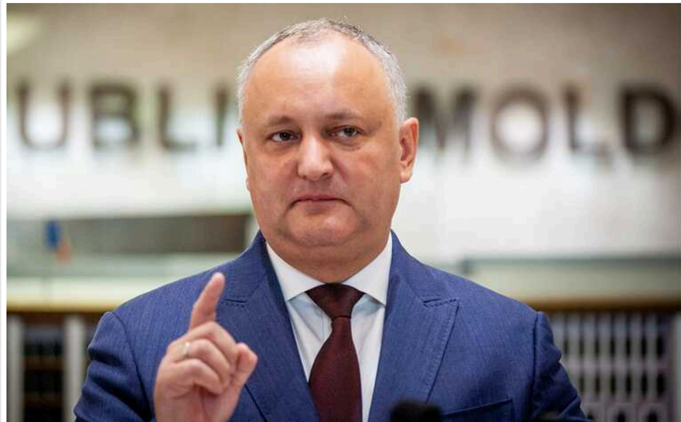
Колишній президент Молдови Додон заявив, що не знає, чи є Херсон і ряд інших регіонів територією України

Колишній президент Молдови (2016–2020 роки) Ігор Додон засумнівався, чи є Крим, Херсонська, Донецька, Луганська й Запорізька області українськими. Мовляв, "за результатами мирних переговорів буде зрозуміло, де зупиниться війна" Російської Федерації проти України.