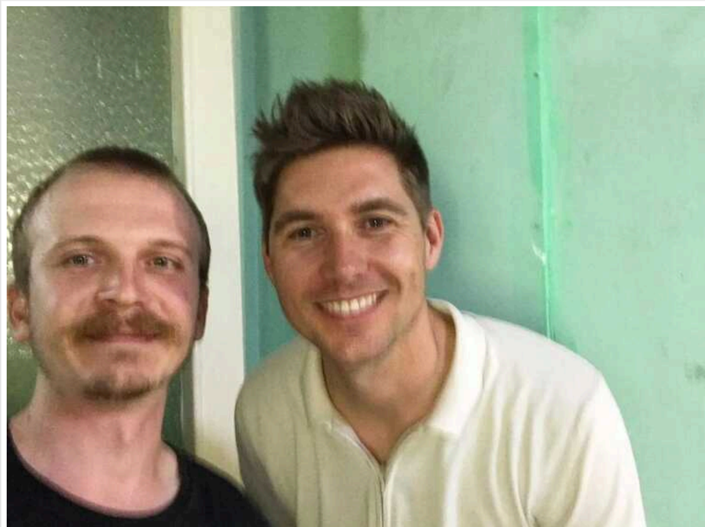
Володимир Остапчук потрапив у скандал через відстрочку від армії: телеведучий відреагував