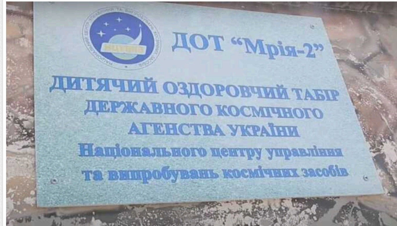
В Одесі корумпованому посадовцю «Укркосмосу» не дали приватизувати державний табір

Цілісний майновий комплекс колишнього держпідприємства «Нефон», до складу якого входить дитячий оздоровчий табір «Казковий» у курортній зоні Одеси, на вулиці Костанді, повернули державі.