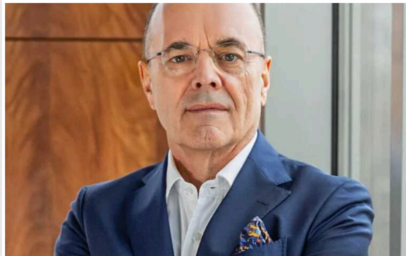
Голова правління ПриватБанку Герхард Бьош іде у відставку

Голова правління ПриватБанку Герхард Бьош залишає свою посаду. Про причину цього поки що невідомо, проте до обрання нового голови правління та завершення всіх пов'язаних із цим процедур він ще виконуватиме обов'язки керівника банку.