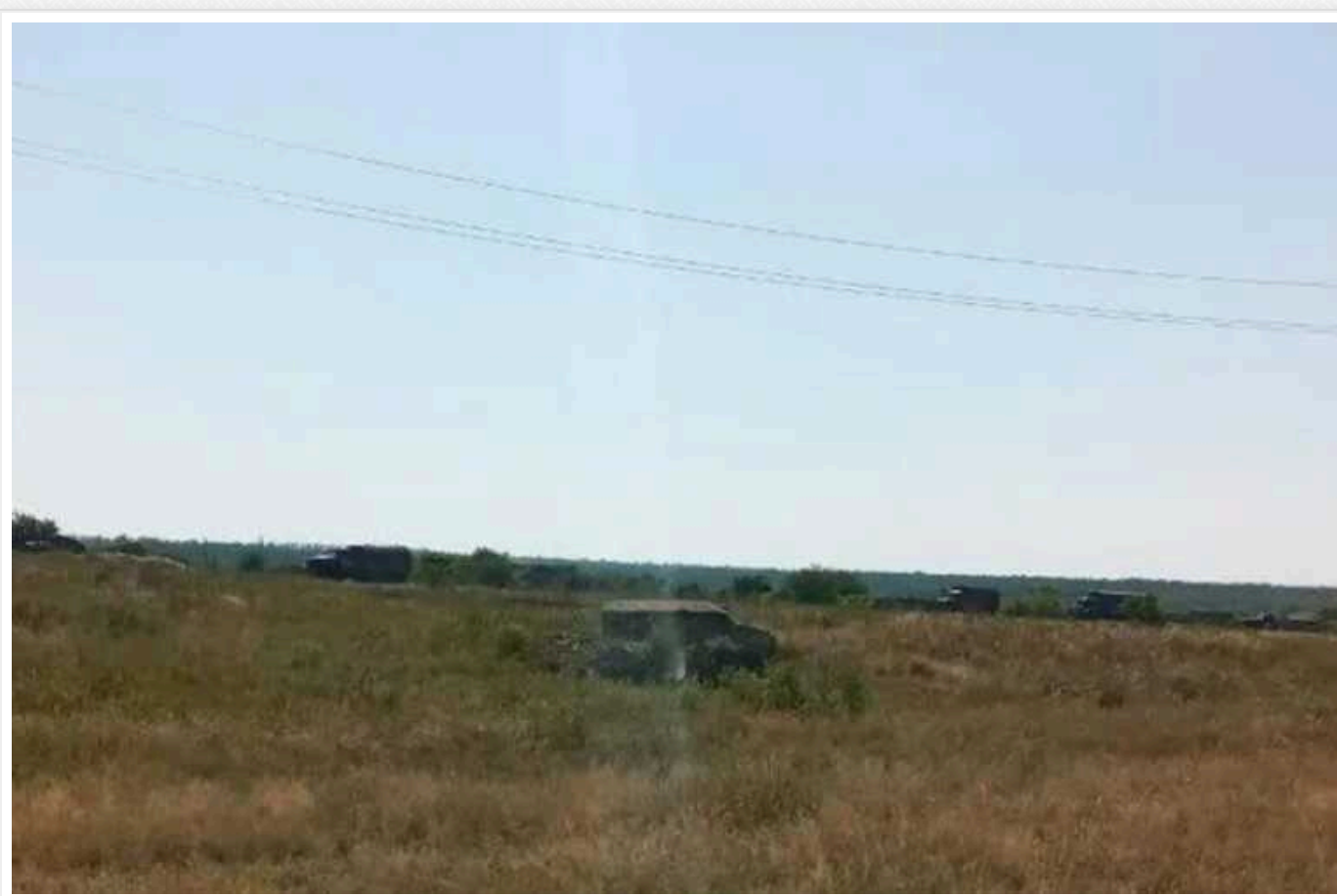
"АТЕШ" на Донеччині виявили базу військ РФ

Український партизанський рух "АТЕШ" виявив добре охоронювану російську військову базу на Донеччині. Партизани припускають, що вона використовується загарбниками для зберігання артилерійських снарядів.